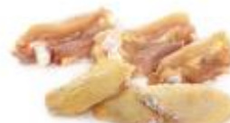
Pack barbacoa **