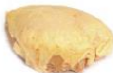
Pechuga con hueso **