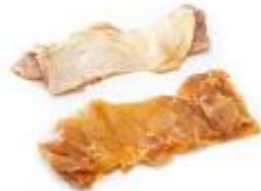
Bistec con piel **