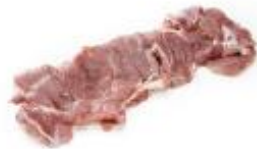
Filete de muslo **