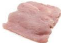
Pechuga fileteada **