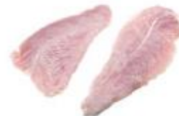
Filete de solomillo **