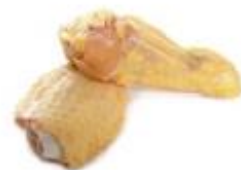
Alas partidas **