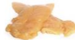
Filete de solomillo **