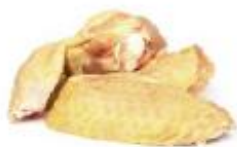
Alas dos falanges **